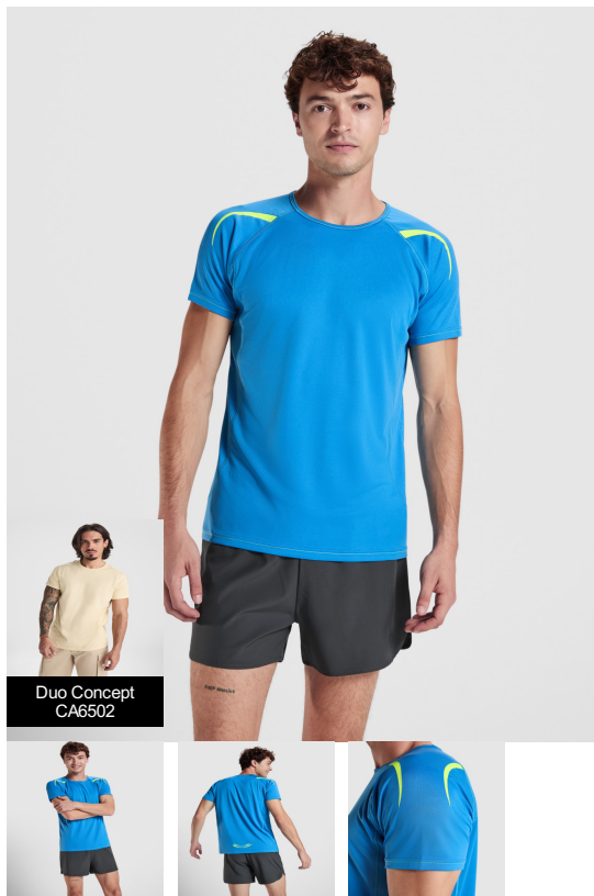
Duo Concept CA6502